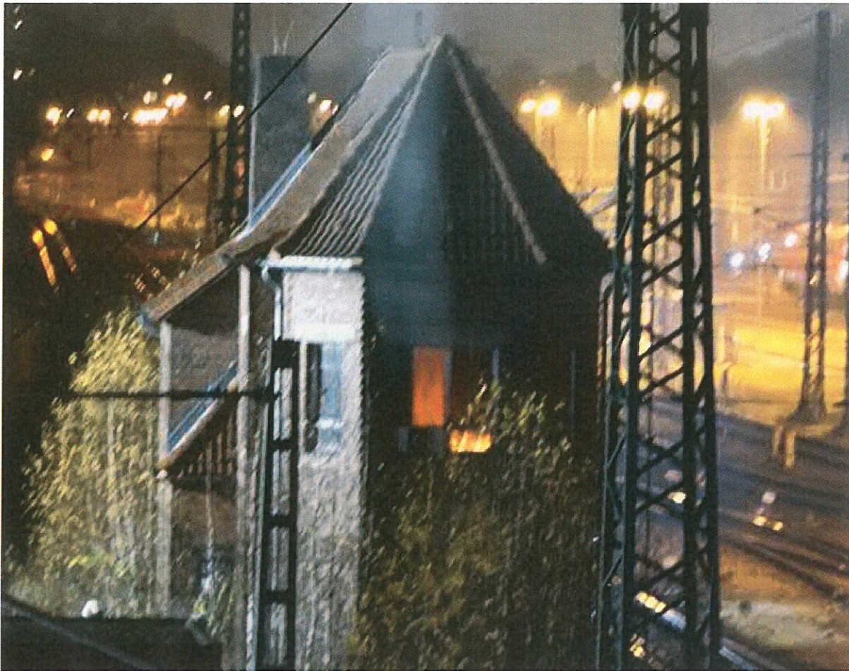
Es brannte im Obergeschoss des ehemaligen Stellwerks. 25.11.2020 18.54