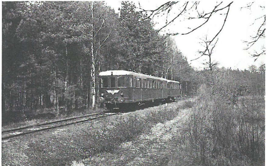
Bild 2: OHE-DT 0514 mit VB 0325 mit Planzug zwischen Neetze und Neu Neetze am 20.4.1962

Die Bedeutung der Bleckeder Kleinbahn seit 1919