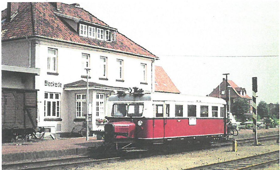
Bild 1: zeigt den „Ameisenbär“ VT 0508 der OHE am 4.8.1973 in Bleckede anlässlich einer Sonderfahrt der Eisenbahnfreunde Hannover

über 200, darunter sind viele Farbabbildungen. Die Auflagenhöhe steht derzeit noch nicht fest. In Abhängigkeit von der Anzahl der Vorbestellungen soll diese dann bestimmt werden.