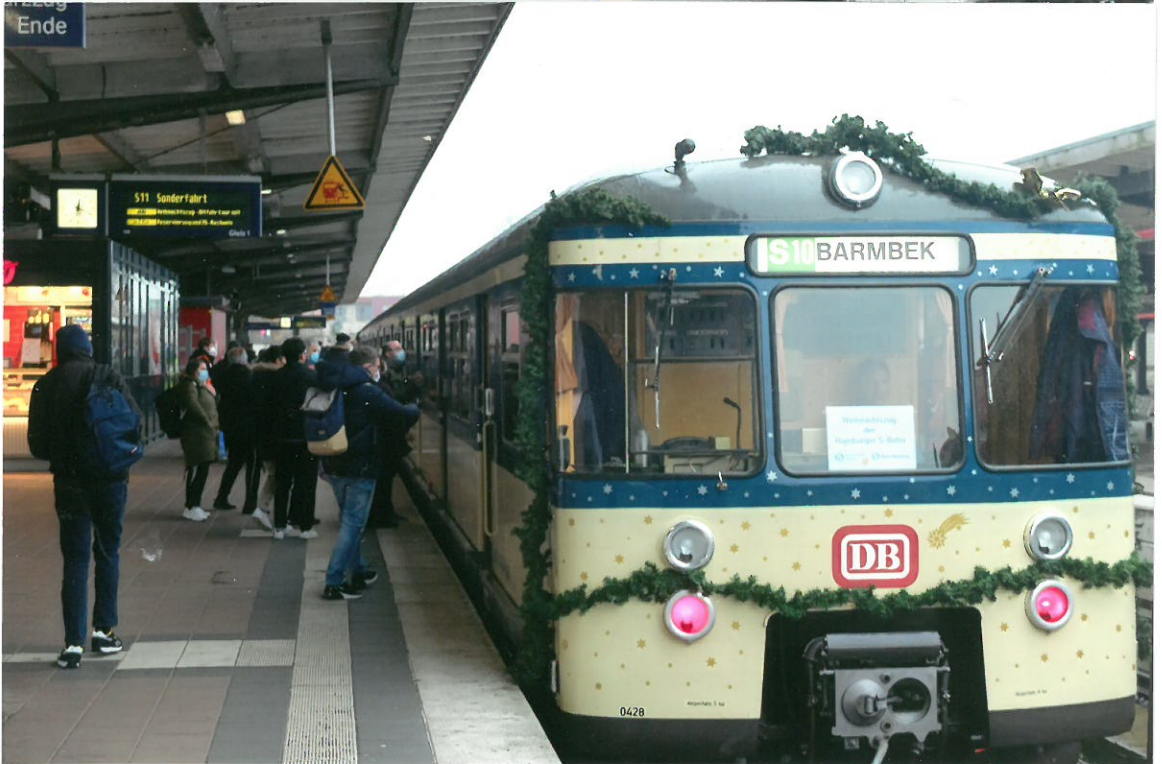
Auch die obigen Bilder zeigen den histor. Hamburger S-Bahn-Zug 470 128 am 4.12.2021 während einer seiner (durchweg gut besuchten) Adventstouren im Bhf. Hamburg-Barmbek.