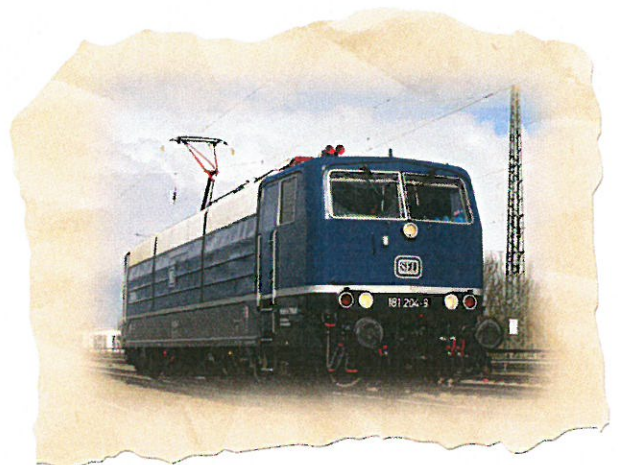
Zuglok 181 204 der Firma Schlünß Eisenbahn Logistik (SEL) zieht unseren Sonderzug.