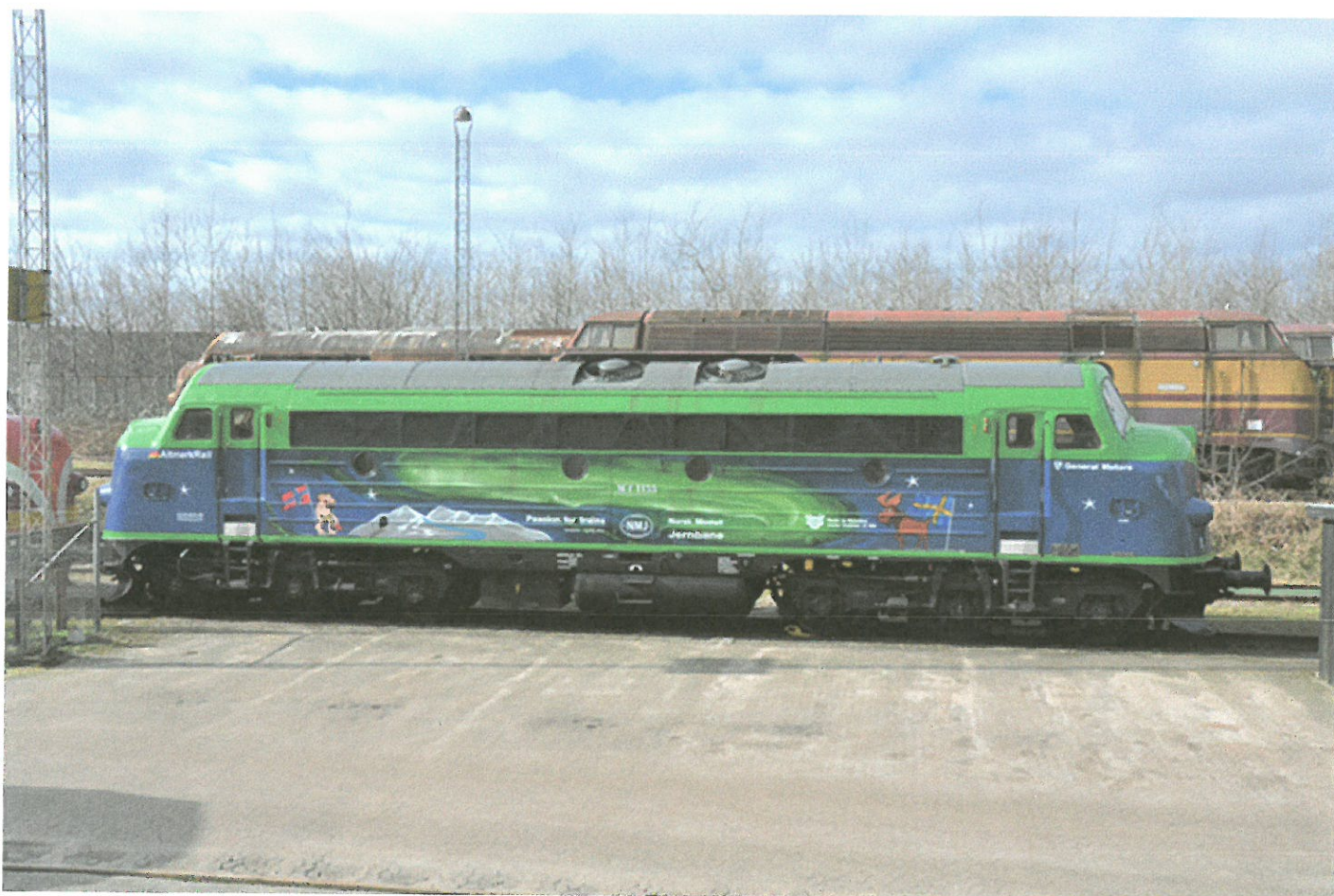
MY 1155.

Anlässlich des 70. Jahrestages der Ankunft von NOHAB MY in Dänemark am 7. Februar 1954 und der Feier des 25. Jahrestages von NOHAB in Deutschland wird es am Wochenende des 1. und 2. Juni eine GM-Ausstellung im Hist. Lokschuppen in Wittenberge geben! Dies wird eine großartige Zusammenarbeit sowohl von deutscher als auch von dänischer Seite sein. Sie versammeln sich im Rahmenwerk rund um das Depot in Wittenberge, wo die teilnehmenden MY-Lokomotiven sowohl von deutscher als auch von dänischer Seite zum ersten Mal seit vielen Jahren wieder zusammen sein werden. Dadurch ist dies eine einmalige Gelegenheit, frühere dänische MYs zusammen mit dänischen MYs zu sehen.