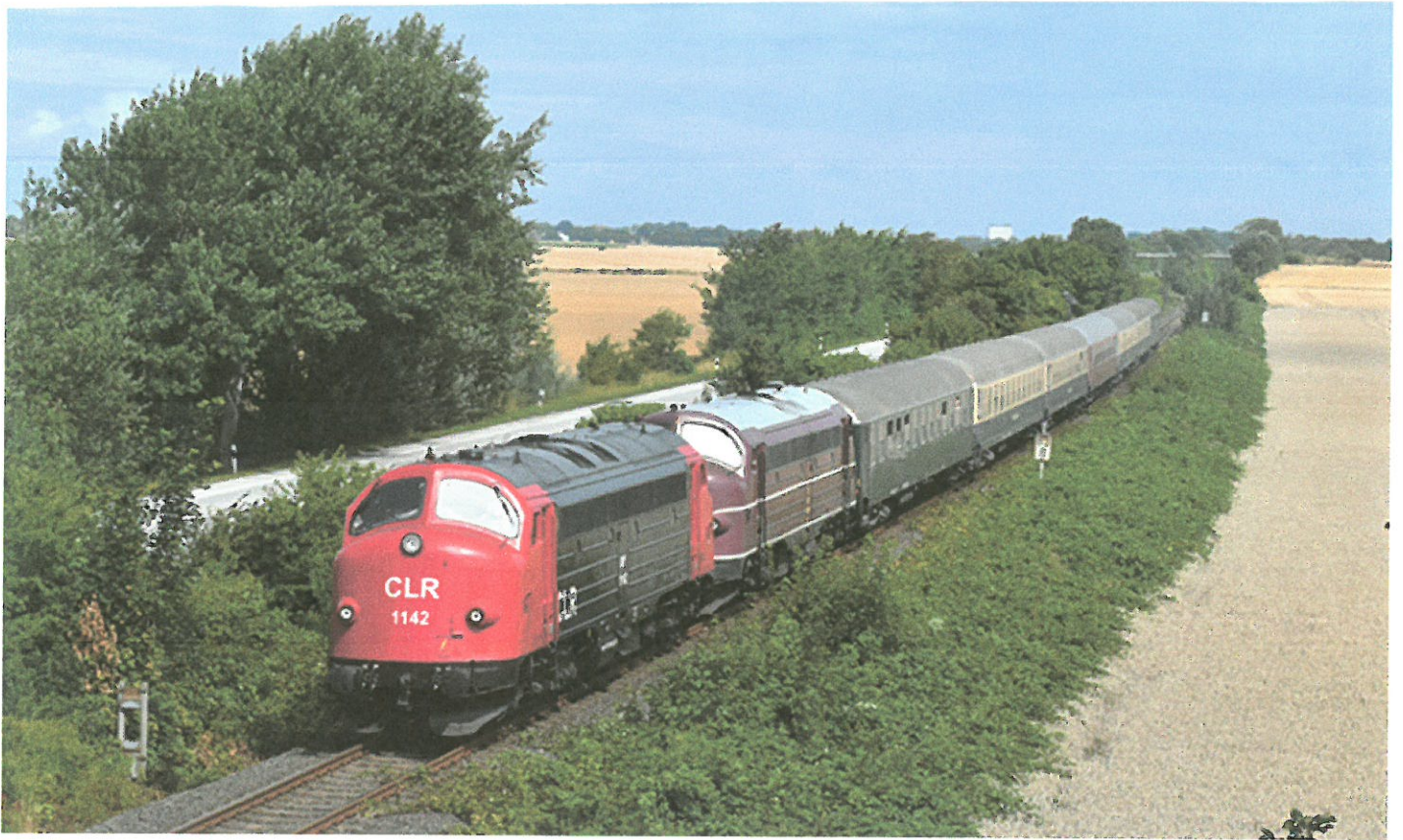
MY 1142.

An dem Treffen werden offenbar sieben von neun ehemaligen dänischen MYs der Unternehmen Altmark Rail, Cargo Logistik Rail und Strabag Rail teilnehmen. Wobei alle fahrtüchtigen MYs in Deutschland teilnehmen werden. Die letzten beiden sind Altmark Rail MY 1127 und 1143, die in Haldensleben weiterhin nicht fahrbereit sind.