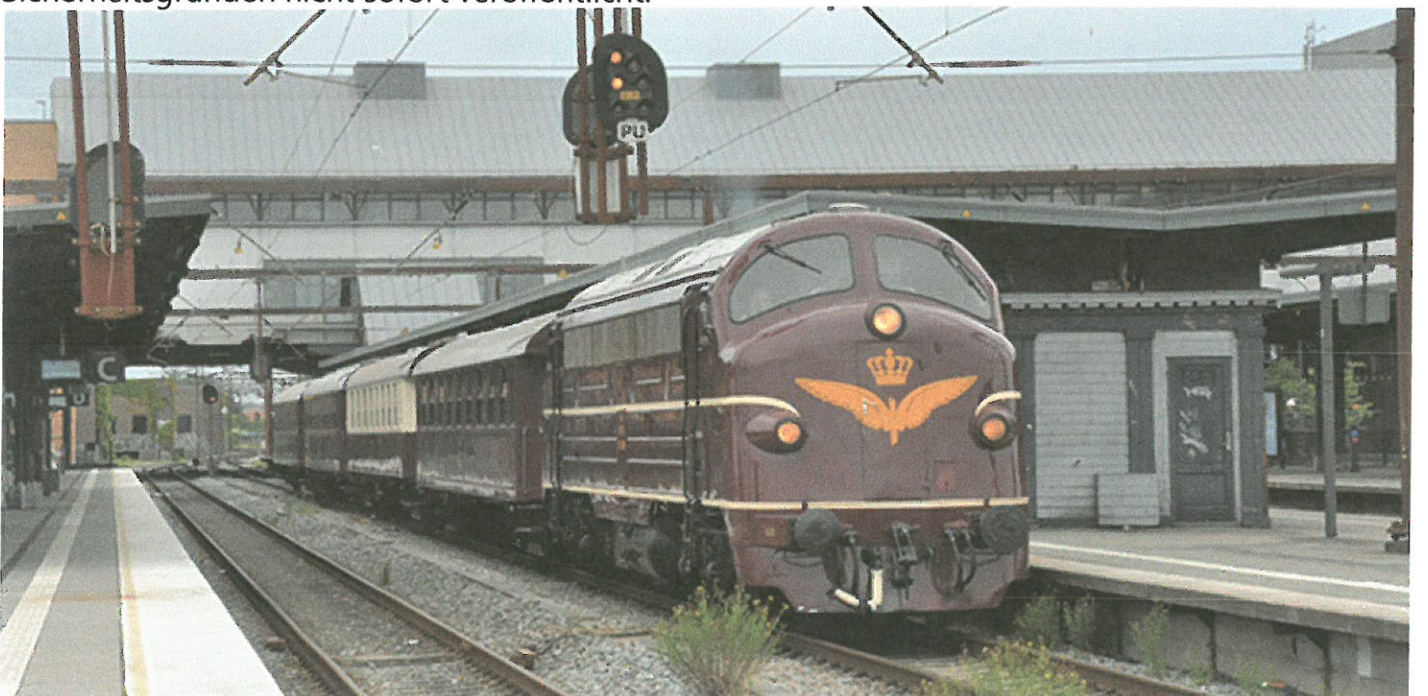
MY 1101.

Dem Plan zufolge werden die dänischen MYs von einem deutschen MY von Padborg nach Wittenberge und zurück gezogen. Die genauen Termine der tatsächlichen Läufe werden aus Sicherheitsgründen nicht sofort veröffentlicht.