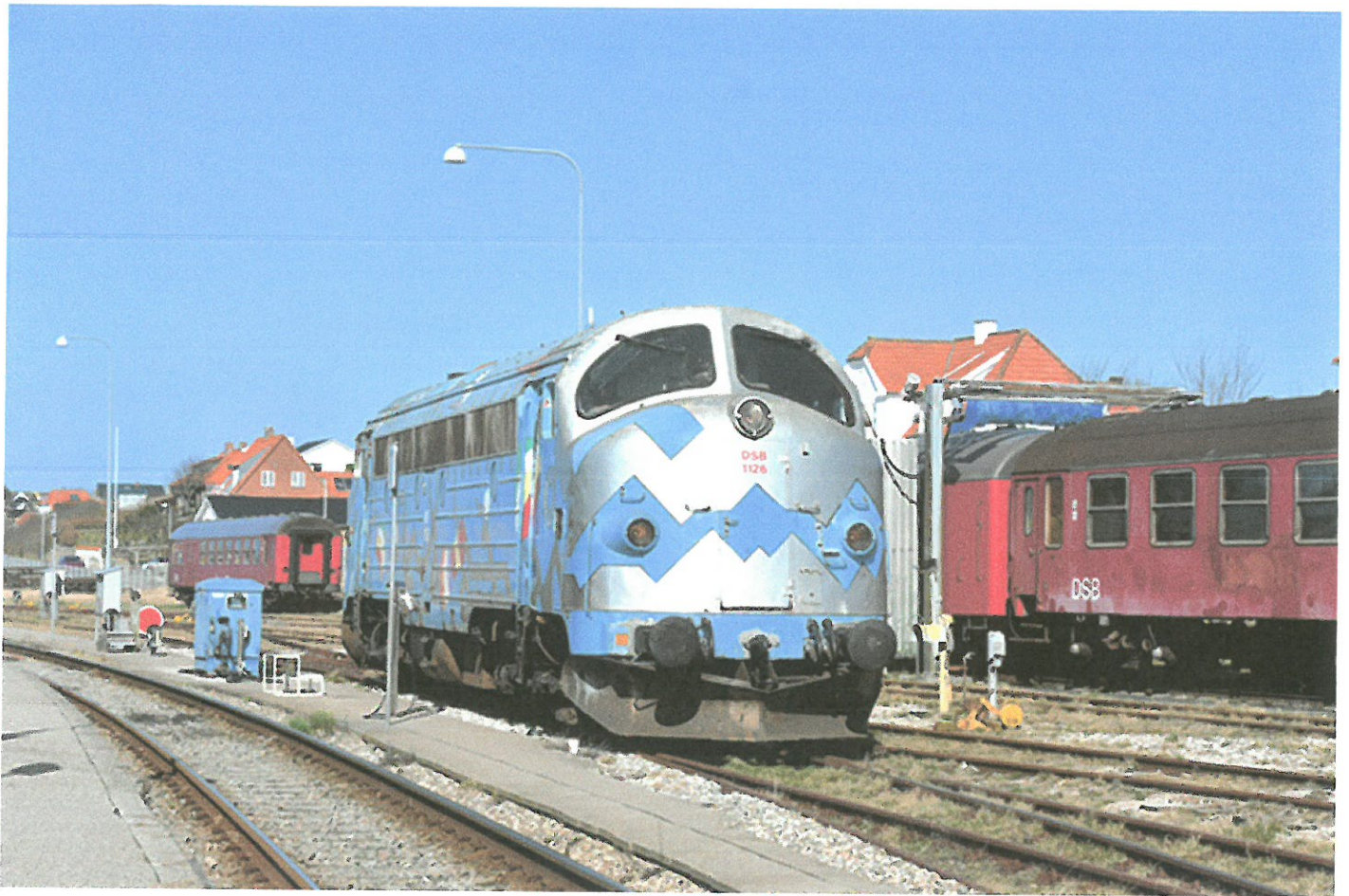
MY 1126.

In Wittenberge werden Fahrten vom Bahnhof Wittenberge und rund um das Hafengelände durchgeführt, ebenso besteht die Möglichkeit, im Fahrerhaus im Depotbereich zu fahren. Beides wird mit den deutschen MYs passieren und nicht mit den dänischen, die in der Gegend ausgestellt werden.